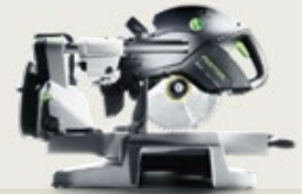
KS 88 Der vielseitige Allrounder.