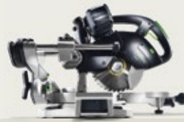
KS 60 Ideal für mobile Einsätze.