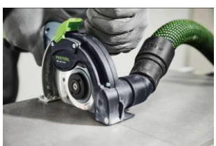
Bild: Festool_ DSC-AGC 18 FH_09.jpg