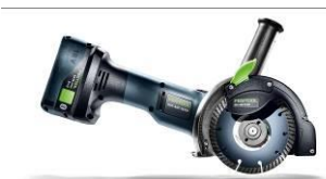
Bild: Festool_DSC-AGC 18 FH _01.jpg

Robust, präzise und kabellos: Das neue Akku-Freihand-Trennsystem DSC-AGC 18 FH.