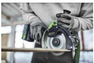
Bild: Festool_ DSC-AGC 18 FH_06.jpg

Um die Vibrationen für den Anwender möglichst gering zu halten, wurden Motor und Gehäuse voneinander entkoppelt.