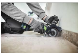
Bild: Festool_ DSC-AGC 18 FH_10.jpg

Dank der integrierten Absaughaube werden über 95 Prozent des anfallenden Staubs direkt zum Absaugmobil transportiert.