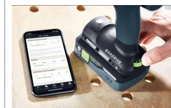
Bild: Festool-Digital-World-3.jpg Mit der Work App lassen sich bestimmte Maschinenfunktionen über die im Akku oder der Maschine integrierte IoT Schnittstelle mit dem Smartphone individualisieren oder die Maschine via App updaten.

Bild: Festool-Digital-World-2.jpg Mit der Order App können Festool Kunden bereits Ersatzteile und Maschinen über den Händler und in Deutschland seit kurzem direkt über den neuen E-Shop beziehen.