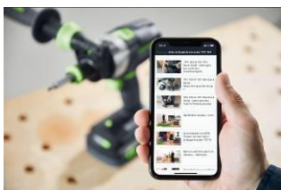
Bild: Festool-Digital-World-5.jpg Die How-to App erleichtert mit zahlreichen Videotutorials das Arbeiten mit unseren Maschinen.