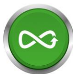
Bild: Festool-Service-Warranty.png Leistung ohne Kompromisse: Ob Reparaturauftrag oder Garantiefall, Diebstahlschutz oder Ersatzteilverfügbarkeit – bei Festool kann man sich auf den umfassenden Service verlassen.

Bild: Festool-Service.jpg Für einen sorgenlosen Alltag sind alle Festool Ladegeräte sowie Akkupacks selbstverständlich wie alle Festool Werkzeuge mit dem Festool Service rundum abgesichert.