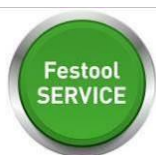
Bild: Festool-Service.jpg Für einen sorgenlosen Alltag sind alle Festool Ladegeräte sowie Akkupacks selbstverständlich wie alle Festool Werkzeuge mit dem Festool Service rundum abgesichert.

Bild: Festool-Digital-World-6.jpg Die How-to App erleichtert mit zahlreichen Videotutorials das Arbeiten mit unseren Maschinen.