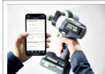
Bild: Festool-Digital-World-4.jpg Mit der Work App lassen sich bestimmte Maschinenfunktionen über die im Akku oder der Maschine integrierte IoT Schnittstelle mit dem Smartphone individualisieren oder die Maschine via App updaten.

Bild: Festool-Digital-World-3.jpg Mit der Work App lassen sich bestimmte Maschinenfunktionen über die im Akku oder der Maschine integrierte IoT Schnittstelle mit dem Smartphone individualisieren oder die Maschine via App updaten.