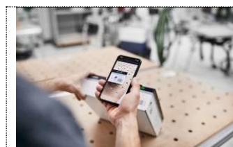
Bild: Festool-Digital-World-1.jpg Der digitale Wandel macht auch vor der Welt der Elektrowerkzeuge nicht Halt. Festool hat diesen Trend früh für sich erkannt und bietet seinen Anwender: innen zunehmend digitale Lösungen an.