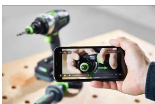
Bild: Festool-Digital-World-6.jpg Die How-to App erleichtert mit zahlreichen Videotutorials das Arbeiten mit unseren Maschinen.

Bild: Festool-Digital-World-5.jpg Die How-to App erleichtert mit zahlreichen Videotutorials das Arbeiten mit unseren Maschinen.