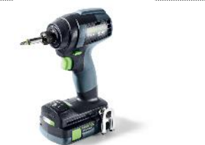
Bild: Festool-Akku-Combo-Sets-29.jpg Der Akku-Schlagschrauber TID 18:

Überzeugend ergonomisch: Die Bauweise des AGC 18 ist konsequent auf optimale Bedienbarkeit beim Trennen ausgelegt. Für besonders hohe Laufruhe und wenig Vibration sind Motor und Gehäuse voneinander entkoppelt.