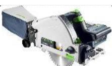
Bild: Festool-Akku-Combo-Sets-09.jpg Akku-Tauchsäge TSC 55 K: Geballte Durchzugskraft und bis zu doppelt so schneller Arbeitsfortschritt bei erhöhter Sägeblatt-Standzeit. Säge-System der Extraklasse dank einer Vielzahl an Zubehör. KickbackStop vermindert die Verletzungsgefahr durch einen Rückschlag beim Sägen oder beim Eintauchen in das Werkstück.

Bild: Festool-Akku-Combo-Sets-08.jpg Akku-Combo-Set Montage: Volle Leistung und hervorragendes Handling mit cleveren Features