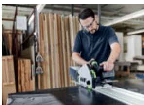
Bild: Festool-Akku-Combo-Sets-11.jpg Die geballte Durchzugskraft der TSC 55 K ermöglicht einen bis zu doppelt so schnellen Arbeitsfortschritt bei erhöhter Sägeblatt-Standzeit. Dabei beeindruckt die neue Sägeblatt-Generation in

Bild: Festool-Akku-Combo-Sets-10.jpg Mehr Sicherheit dank einzigartigem KickbackStop: Der eingebaute KickbackStop der TSC 55 K vermindert die Verletzungsgefahr durch einen Rückschlag beim Sägen oder beim Eintauchen in das Werkstück.