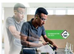
Bild: Festool-Akku-Combo-Sets-10.jpg Mehr Sicherheit dank einzigartigem KickbackStop: Der eingebaute KickbackStop der TSC 55 K vermindert die Verletzungsgefahr durch einen Rückschlag beim Sägen oder beim Eintauchen in das Werkstück.

Bild: Festool-Akku-Combo-Sets-09.jpg Akku-Tauchsäge TSC 55 K: Geballte Durchzugskraft und bis zu doppelt so schneller Arbeitsfortschritt bei erhöhter Sägeblatt-Standzeit. Säge-System der Extraklasse dank einer Vielzahl an Zubehör. KickbackStop vermindert die Verletzungsgefahr durch einen Rückschlag beim Sägen oder beim Eintauchen in das Werkstück.